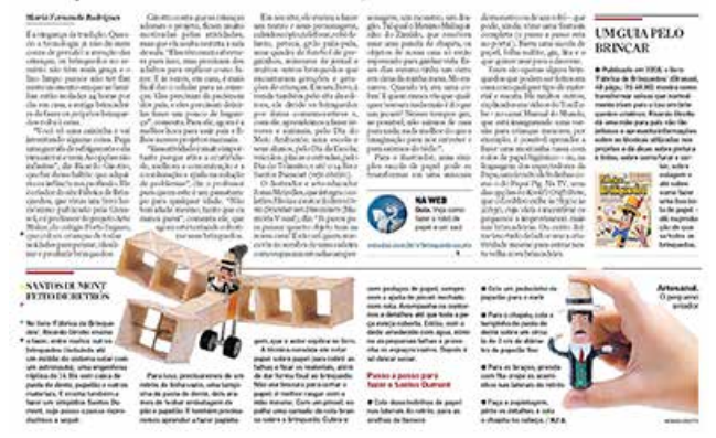
Matéria publicada no jornal ESTADÃO | 11/ maio/2020