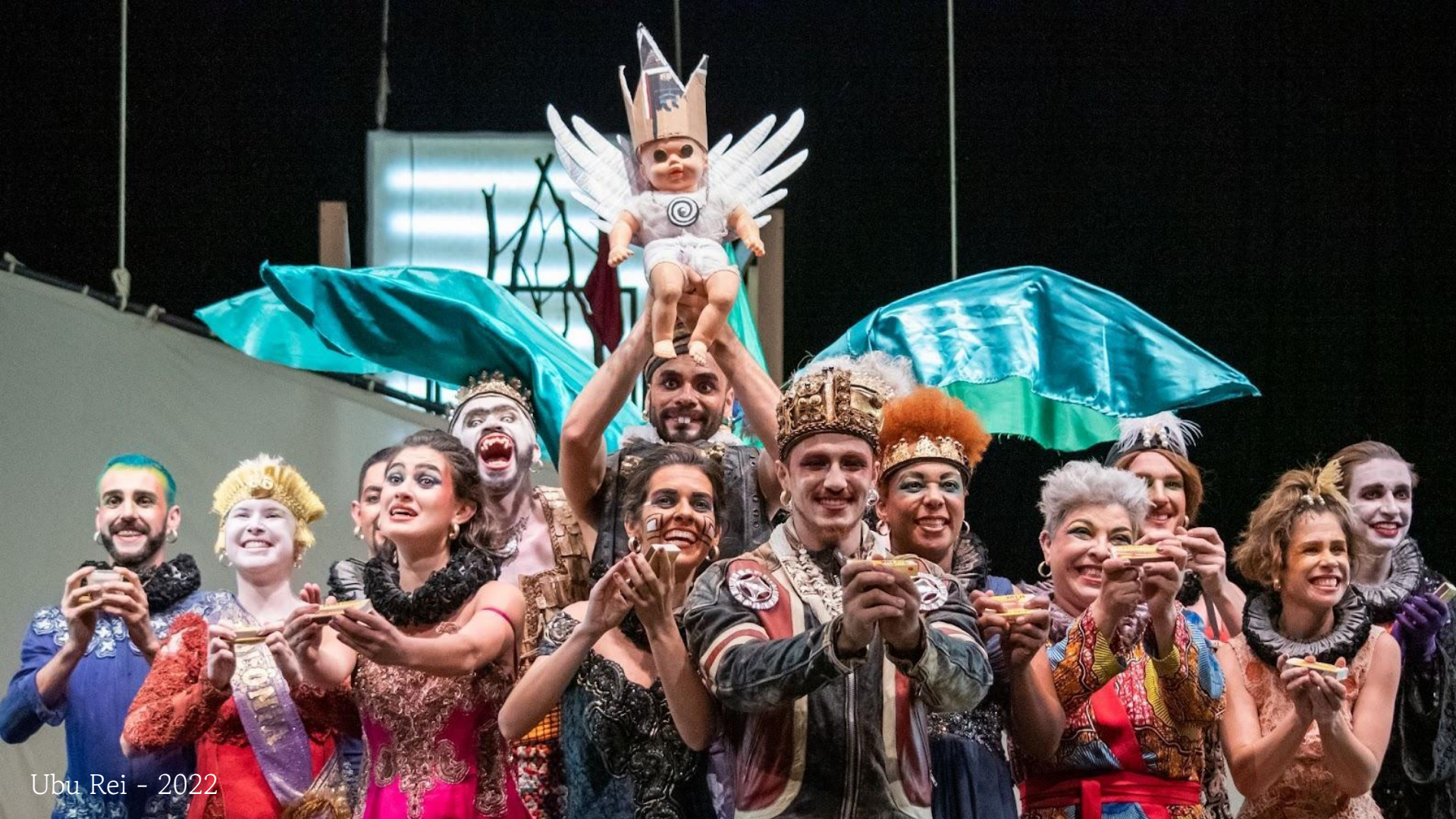
Ubu Rei - 2022