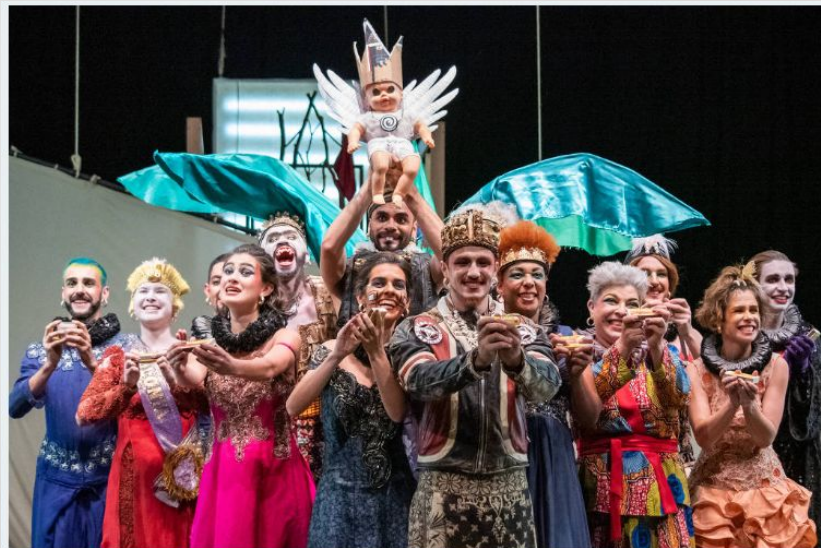
Os Geraldos em cena na montagem de "Ubu Rei", dirigida por Gabriel Villela - Stephanie Lauria

A obra traça o perfil alegórico de um político que se torna rei usando de trapaças e artimanhas, incentivado pelo personagem de Mãe Ubu, figura que introduz na cabeça do marido ideias sobre como seu governo deveria ser --o que, mais tarde, resulta em uma sucessão de atrocidades.