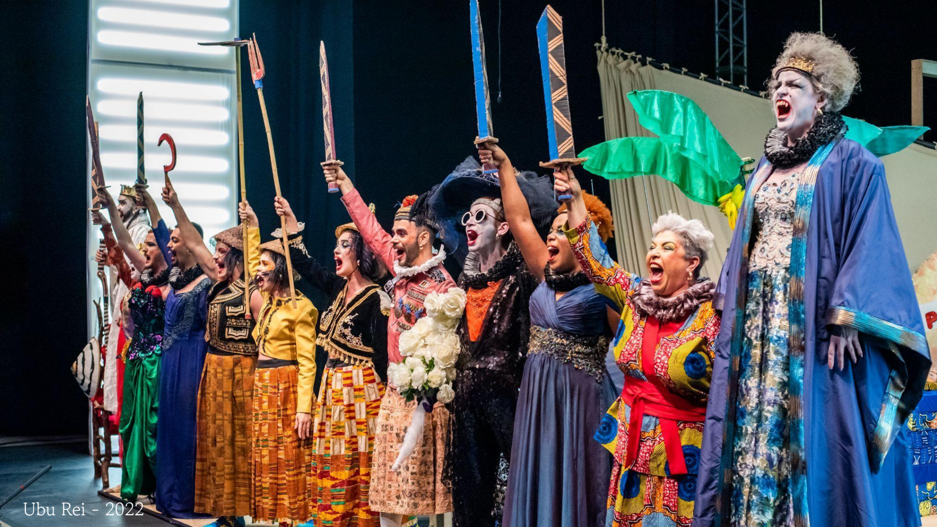
Ubu Rei - 2022