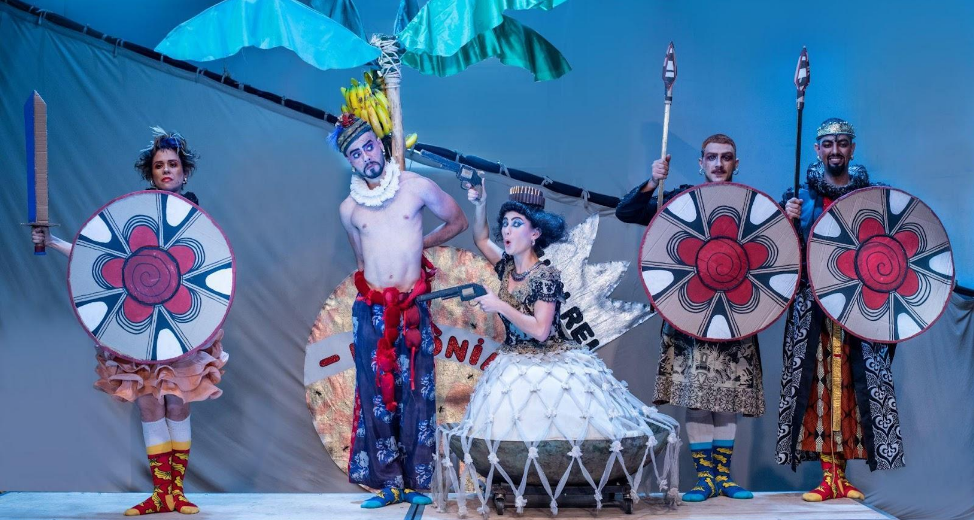
Ubu Rei - 2022