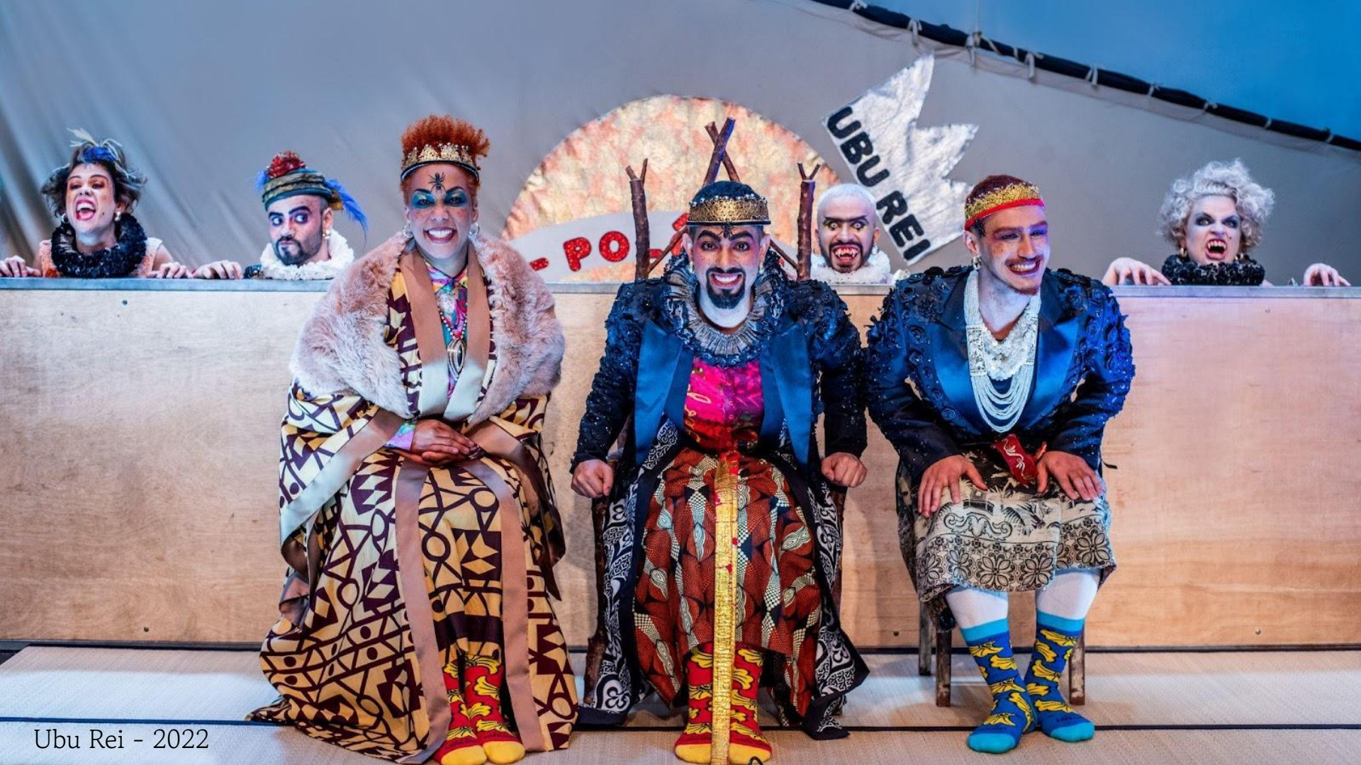
Ubu Rei - 2022